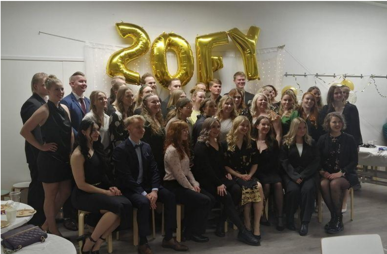
Kuva 2. TAMKista valmistuneet fysioterapeutit.

Terveisin Hannele Anttila, opiskelijavastaava