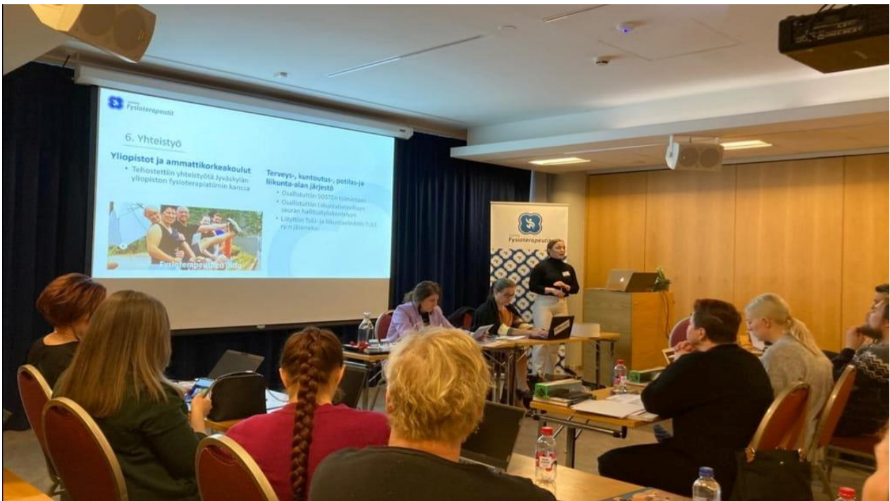
Kuva 1. Edustajiston kokous 24.11.2024 Original Sokos Hotel Vantaassa.

Tähän edustajiston kokoukseen oli kutsuttu ensimmäistä kertaa mukaan myös liiton erikoisalayhdistykset, joilla oli kokouksessa puhe- ja läsnäolo-oikeus. He eivät osallistuneet päätöksentekoon, mutta heillä oli mahdollisuus esittää kokouksessa näkemyksiään käsiteltävistä asioista.